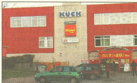
Wird abgerissen: das Hollenstedter Kaufhaus Kück

Interesse an der Wiese hat auch Christian Mausolf vom Kaufhaus Kück. Er will eine Bauvoranfrage an die Gemeinde stellen, um dort ein kleines Kaufhaus mit 600 Quadratmetern Verkaufsfläche zu errichten. Sollte diese positiv beschieden werden, habe die Volksbank den Verkauf des Grundstücks an ihn in Aussicht gestellt.